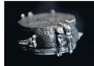
Zilveren object met kneedzilveren figurijtjes.

den door recycling gewonnen. „De Japanse fabrikant haalt zilverresten uit de film- en foto-industrie, die vroeger gewoon in het afvoewater verduwen. Je kent dat wel: leg maar eens een panty in het afvoertuig, en je ziet het.“