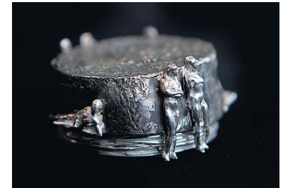
Zilveren object met kneedzilveren figurijtjes.

den door recycling gewonnen. „De Japanse fabrikant haalt zilverresten uit de film- en foto-industrie, die vroeger gewoon in het afvoewater verdwenen. Je kent dat wel: leg maar eens een panty in het afvoertputje, en je ziet het.“