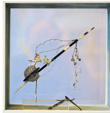
Zilveren object met de naald van het Afrikaans stekelvarken.

Door de ruimte: „de verwarming is wel een lastig punt, ik moet zelfs oppassen dat mijn hamers niet gaan roesten“ kan er veel. Broers maakt er niet alleen haar eigen sieraden, maar geeft sinds enige tijd ook workshops met acs (clay silver), ook wel kneedbaar zilver genoemd.