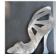
Ontwerp voor de wisselbokaal van de Gorredijkster Stilettoor.